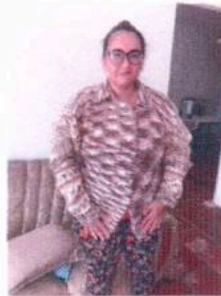
2 - Oficina de Tricô