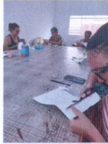
6 – Reunião da equipe SUAS