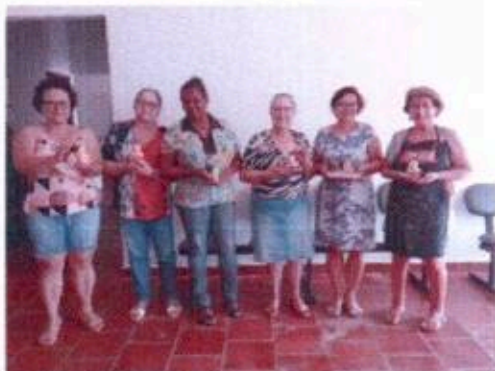
5 - Oficina de Artesanato em peças de gesso