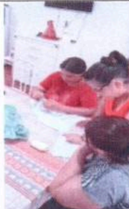
6 - Oficina de Crochê em bico