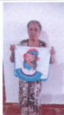
4 - Oficina de Pintura em tecido