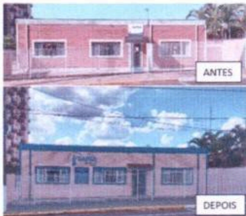
11 - Revitalização da sede