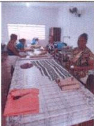
1 - Oficina de Costura