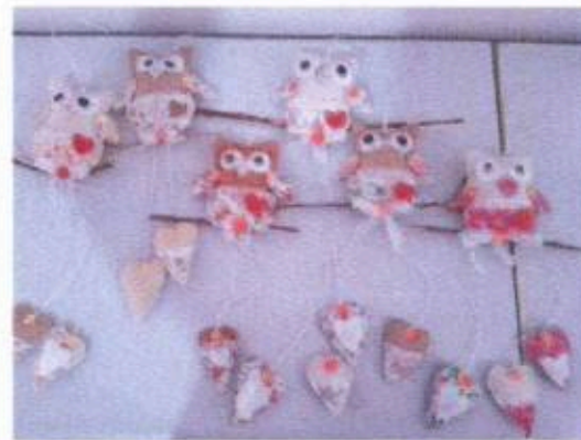
4- Oficina de Artesanato com Tecido e Feltro