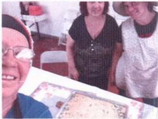
3 – Oficina de Culinária