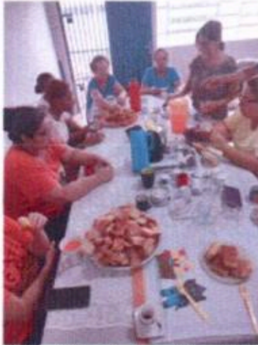
5 - Oficina de Horta e Jardinagem