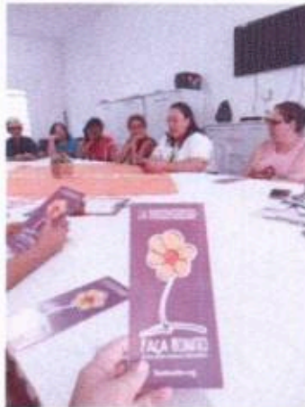
7 – Reunião do SCFV