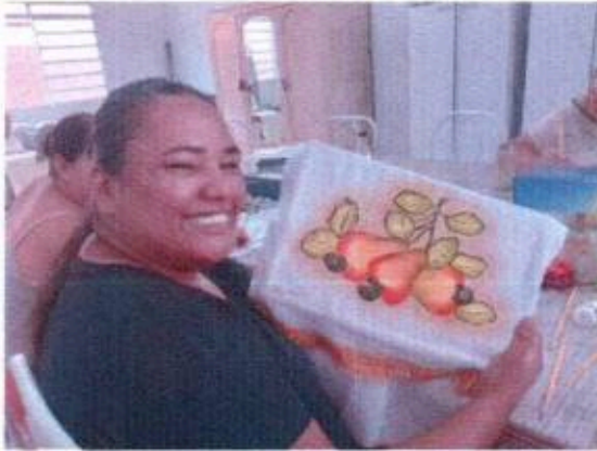
1 - Oficina de Pintura em tecido