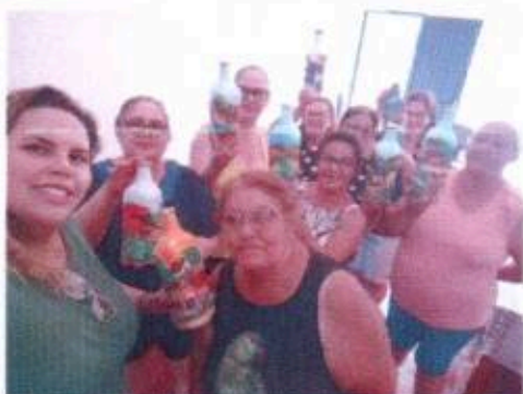
3 - Oficina de Pintura em Vidro