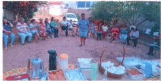
8 - Reunião do SCFV