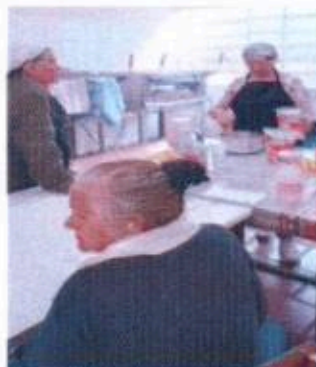
2 - Oficina de Culinária