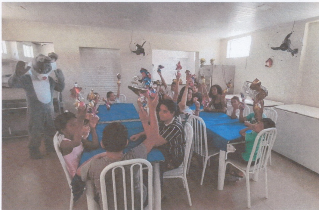
Entrega dos Ovos de Páscoa