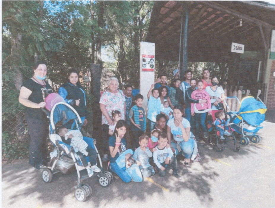
Passeio no Zoológico