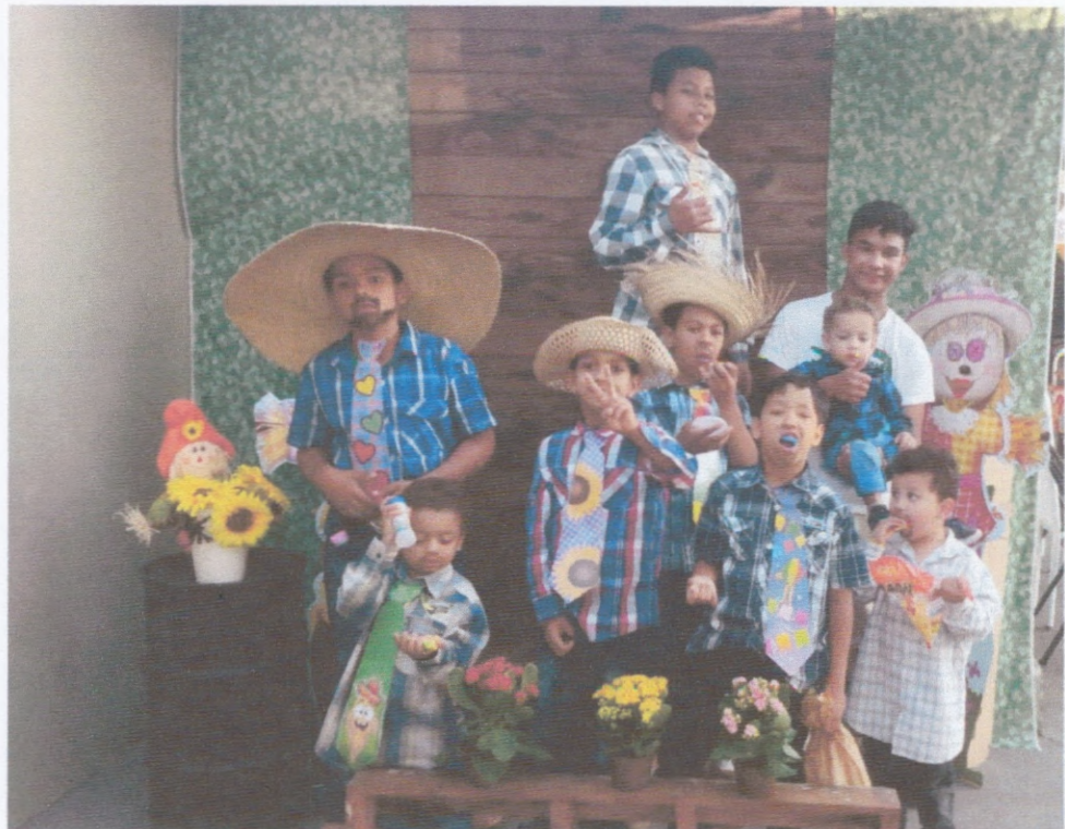
Festa Junina Casa Renascer