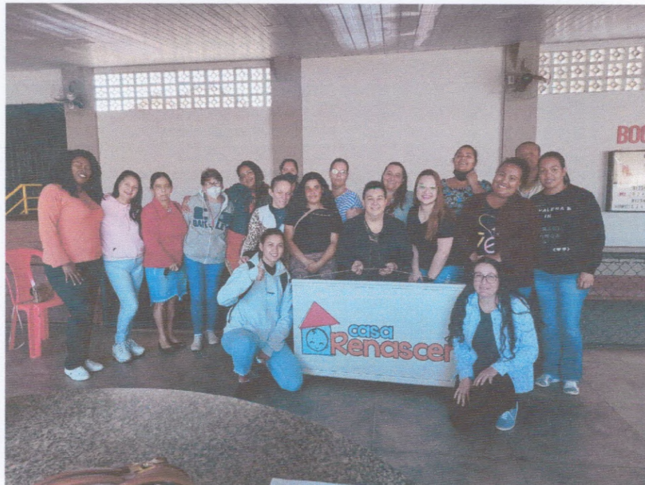
Capacitação dos Cuidadores