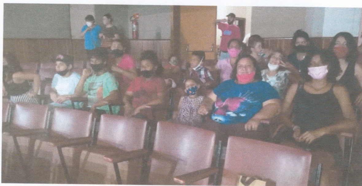
Acolhidos presentes no Festival de Ballet