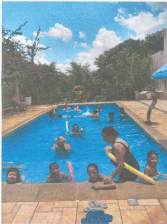
Dia de Lazer

End. Rua Ratelif, 62 – Centro, 17132-000 – Agudos/SP CNPJ 57.273.336/0001-45 Tel (14) 3262-2021 E-mail adm_coordenacaorenascer@outlook.com