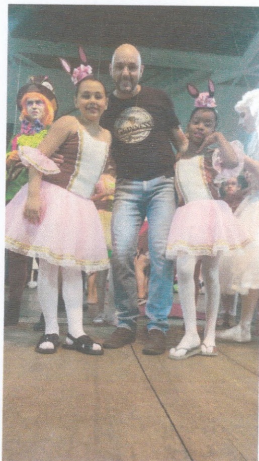
Festival de Ballet