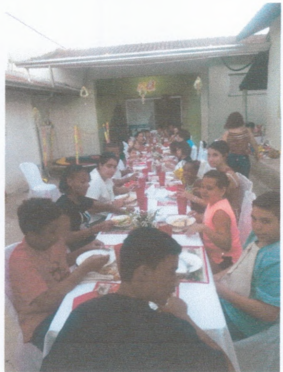
Ceia de Natal / Entrega de presentes