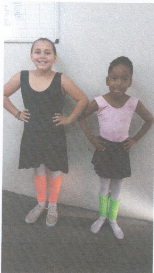
Início das aulas de Ballet

E-mail adm_coordenacaorenascer@outlook.com