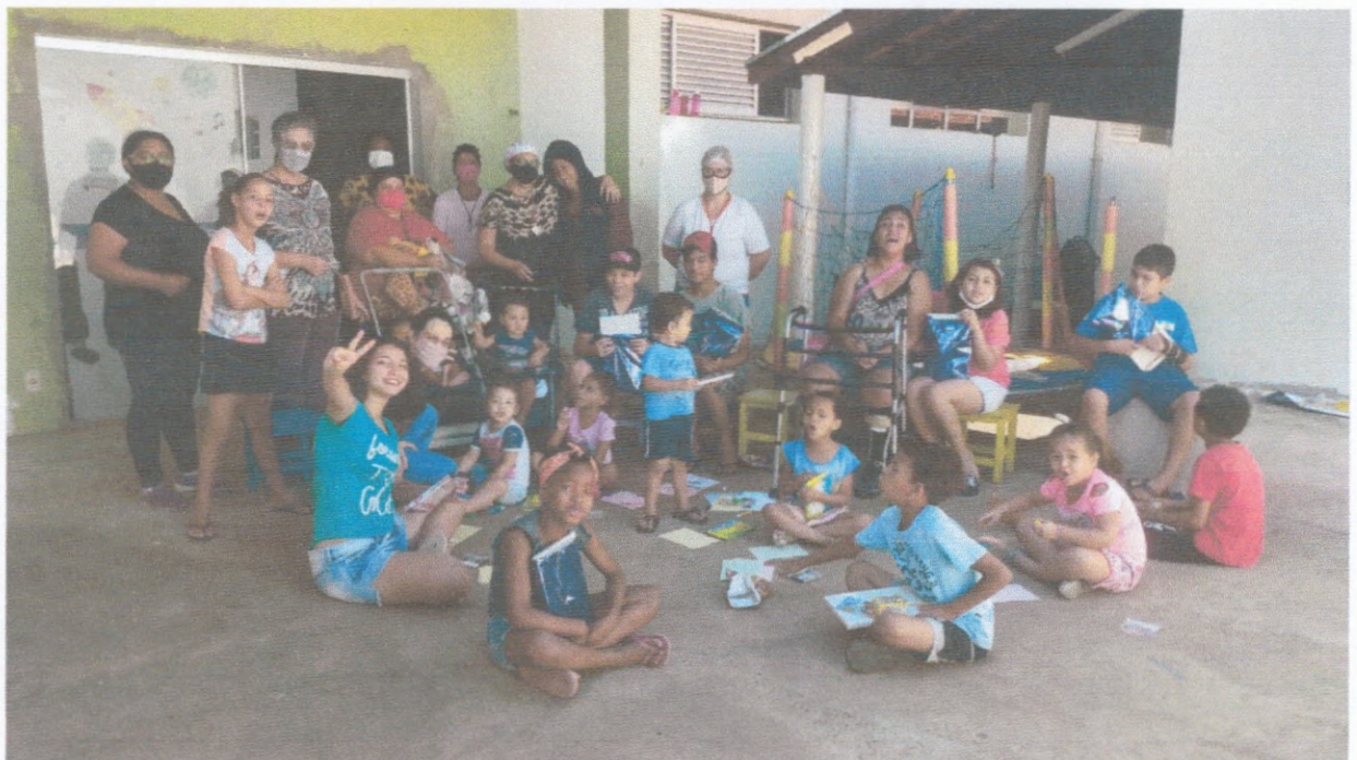
Dia das Crianças