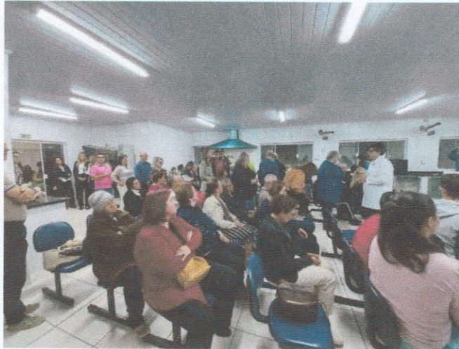
“Festa Junina na Caixa”