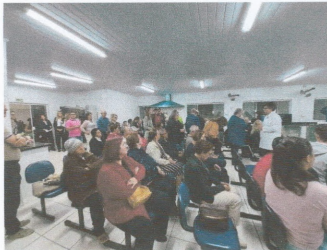
“Festa Junina na Caixa”