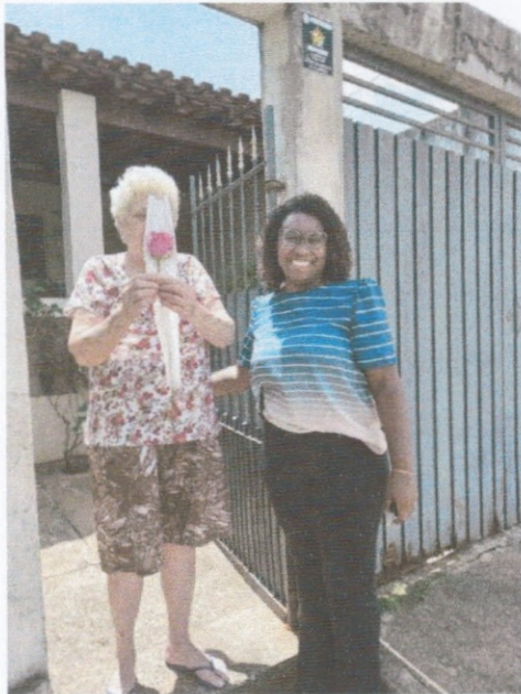
“Dia Internacional da Mulher”