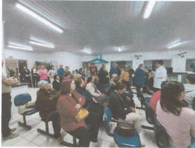
“Festa Junina na Caixa”