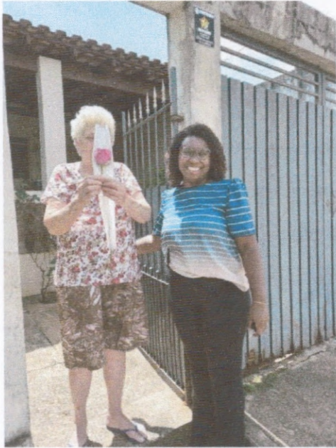
“Dia Internacional da Mulher”