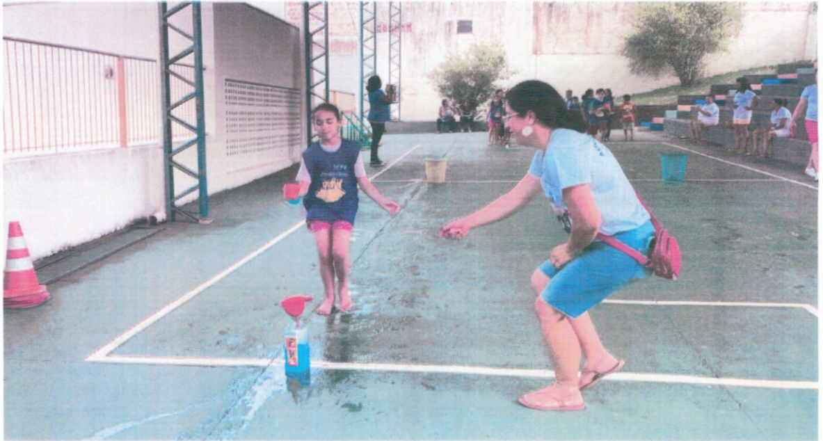
Recreações do Mês das Crianças: Gincana na Escola EMEI Clélia Napoleone Crema com a Casa Renascer

ASSOCIAÇÃO ESPÍRITA ANDRÉ LUIZ RUA PREF. DR. ANTÔNIO CONDI, 1287 CEP: 171200-074. AGUDOS SP FONE: 3443-1048 CNPJ 48375547/0001-06 EMAIL: associacaoespiritaandreluiz@outlook.com CONSELHO MUNICIPAL DE ASSISTÊNCIA SOCIAL nº 19