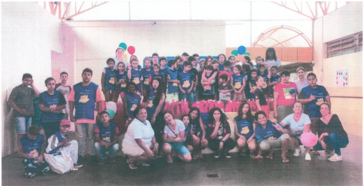
Recreações do Mês das Crianças: Gincana na Escola EMEI Clélia Napoleone Crema com a Casa Renascer

ASSOCIAÇÃO ESPÍRITA ANDRÉ LUIZ RUA PREF. DR. ANTÔNIO CONDI, 1287 CEP: 171200-074. AGUDOS SP FONE: 3443-1048 CNPJ 48375547/0001-06 EMAIL: associacaoespiritaandreluiz@outlook.com CONSELHO MUNICIPAL DE ASSISTÊNCIA SOCIAL nº 19