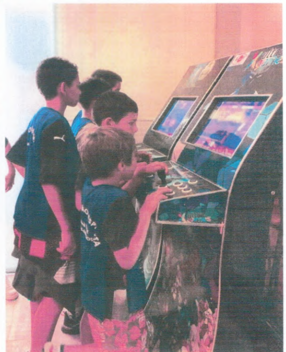
Recreações do Mês das Crianças: Estação Lanches