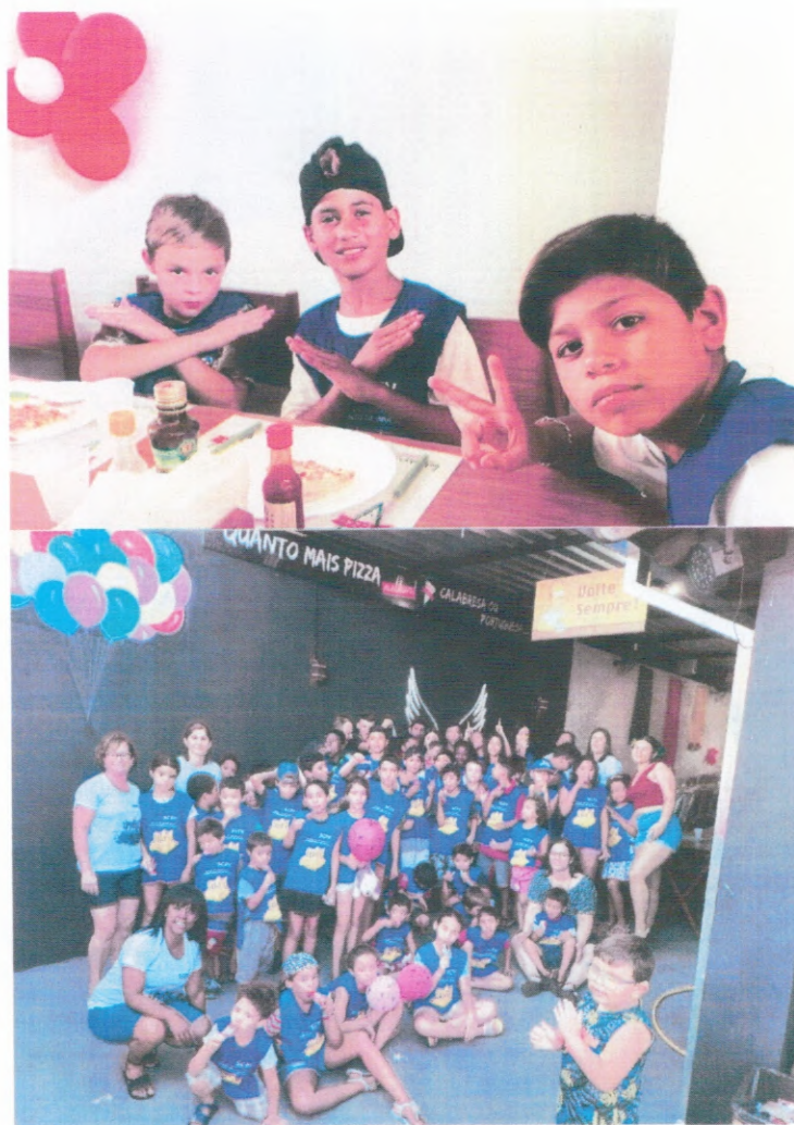
Recreações do Mês das Crianças: Pizzaria Roteli