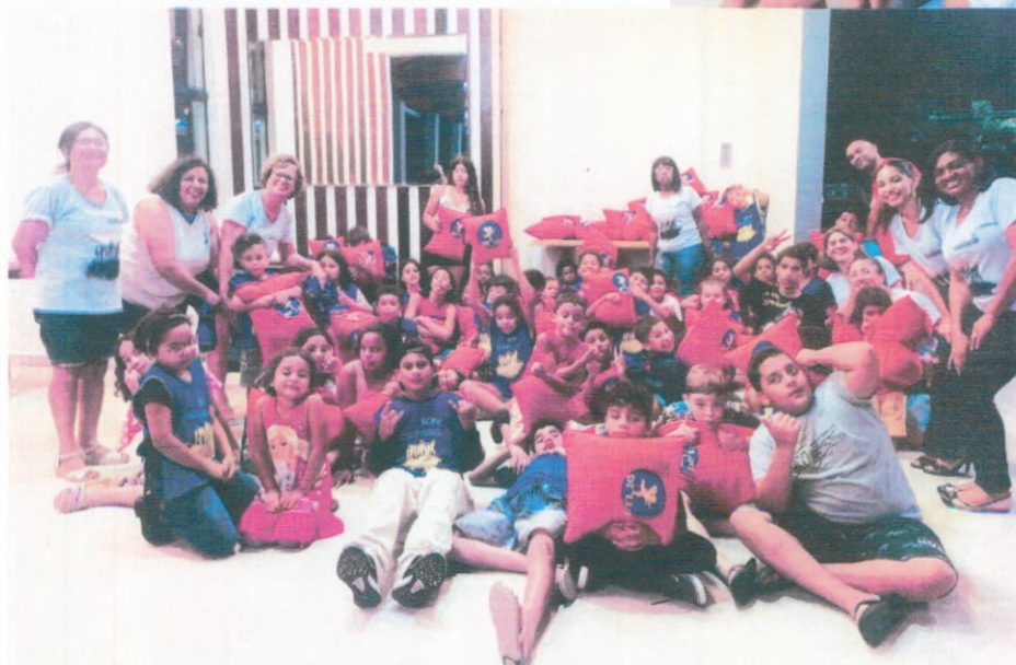
Jantar de Confraternização: SCFV Buffet Realize Eventos