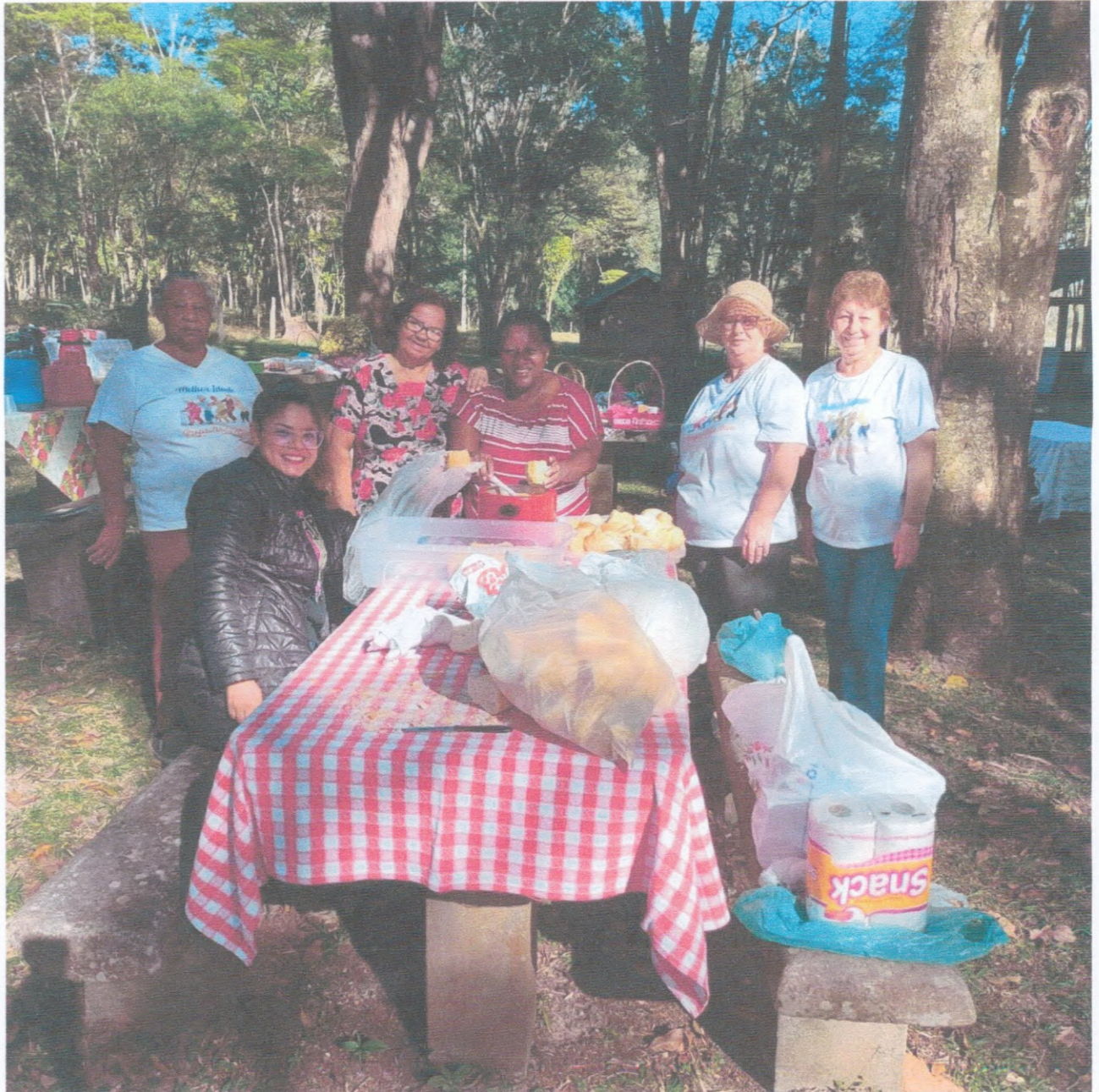
Pique Nick Seminário Família AATI Grupo SCFV

AATI ASSOCIAÇÃO AGUDENSE DA TERCEIRA IDADE CNPJ 01746919000191