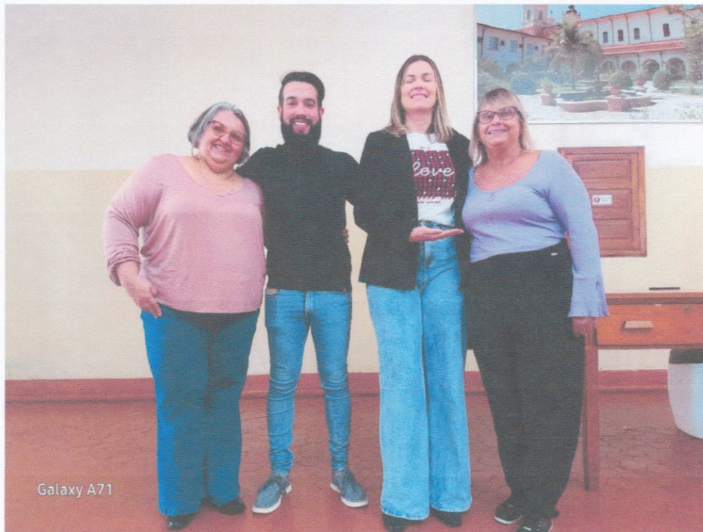
Reunião Social Seminário