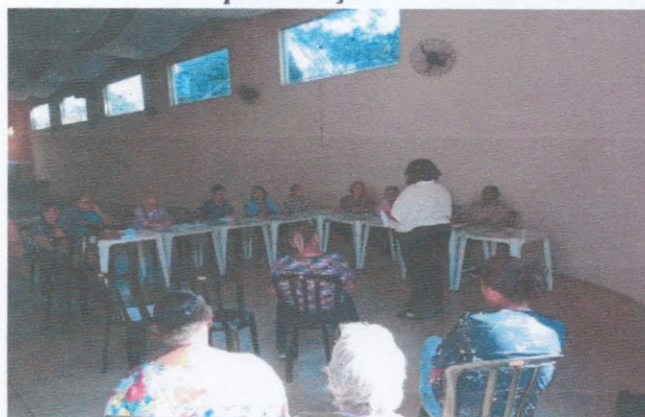
Roda de Conversa Grupo SCFV