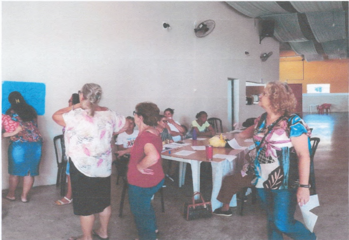
Grupo Semanal SCFV

AATI ASSOCIAÇÃO AGUDENSE DA TERCEIRA IDADE CNPJ 01746919000191