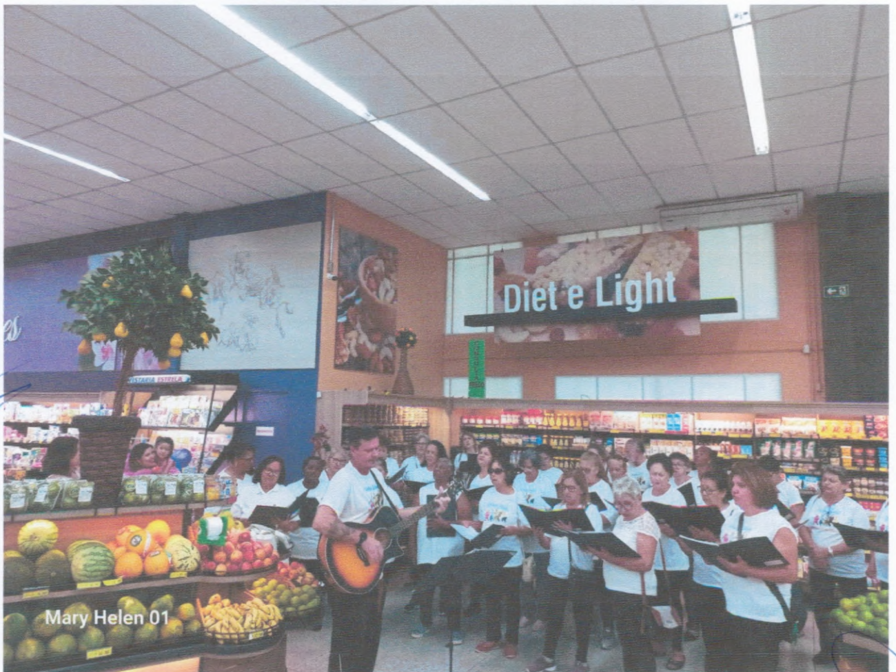
Apresentação do Coral Supermercado Estrela RUA CARLOS GOMES, 20- CENTRO - AGUDOS/SP