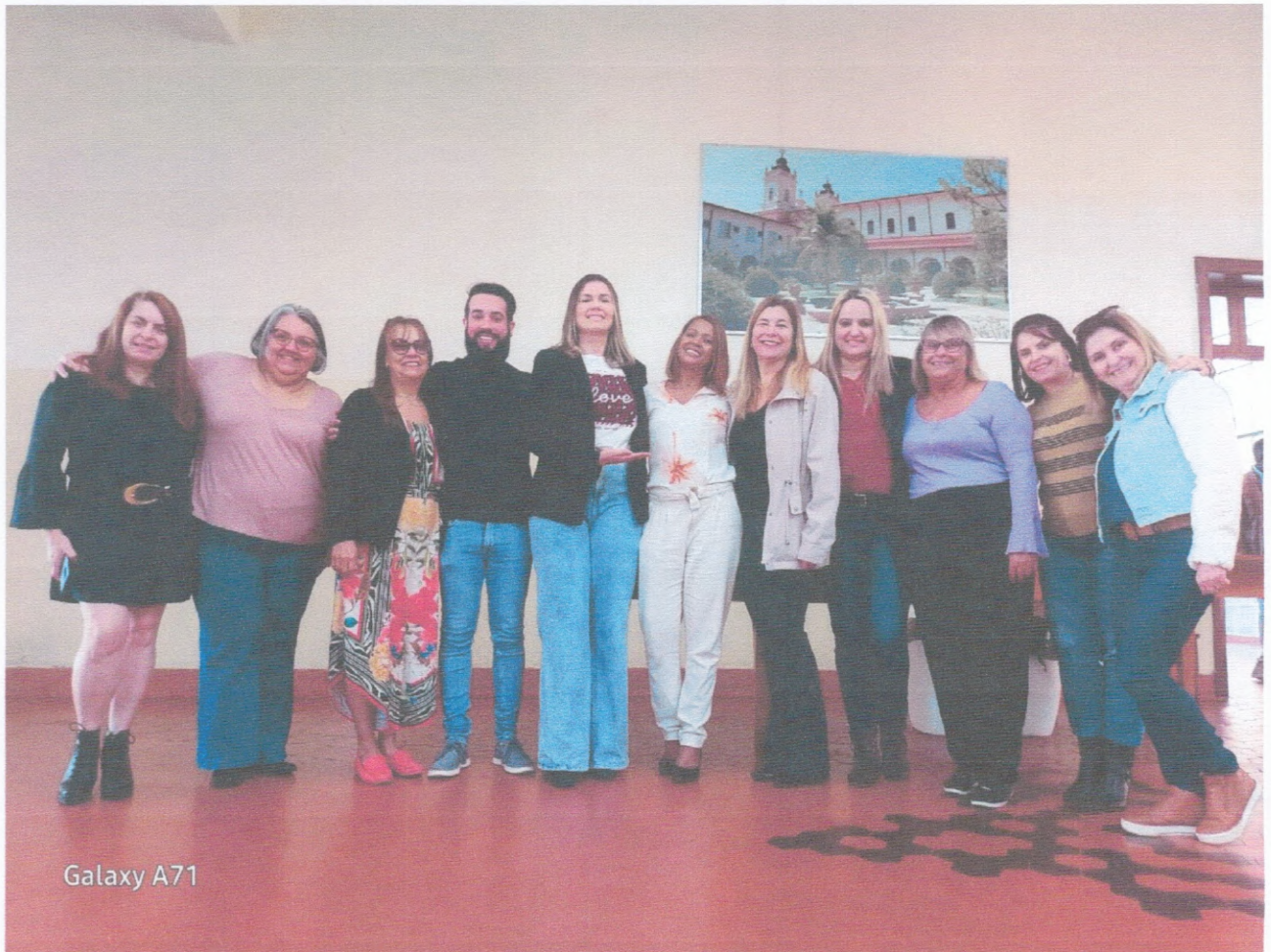
Reunião Social Seminário

AATI ASSOCIAÇÃO AGUDENSE DA TERCEIRA IDADE CNPJ 01746919000191