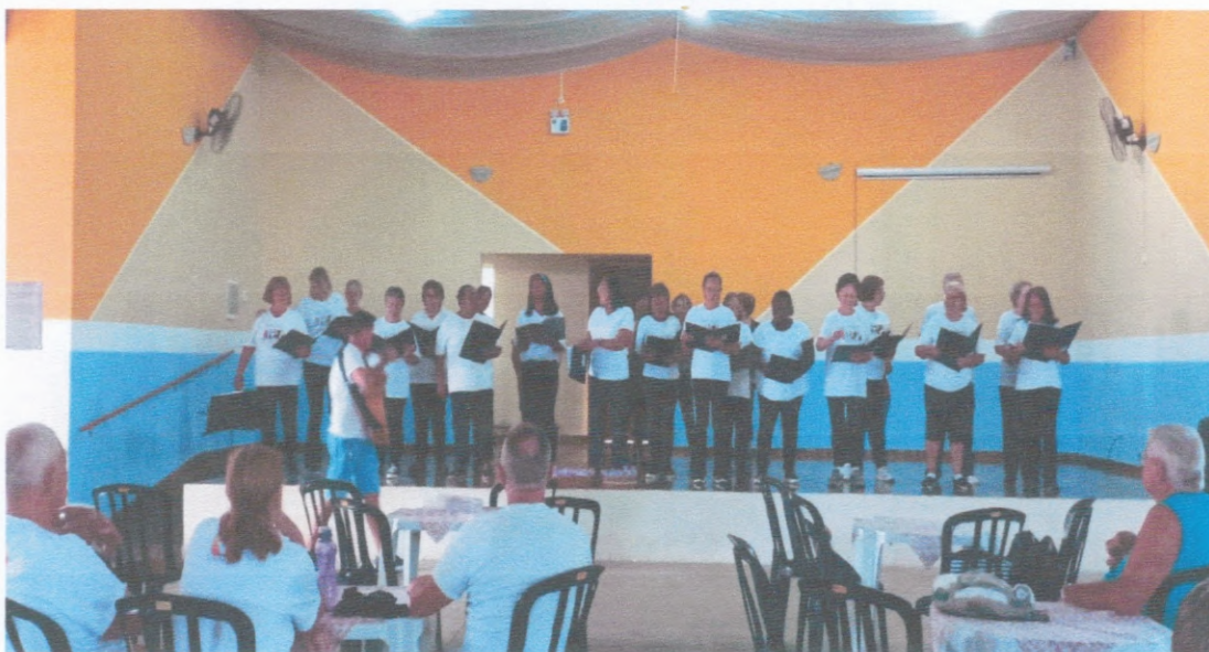
Apresentação Coral Dia Das MÃES