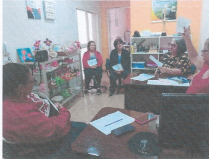
Reunião de equipe com discussão de casos