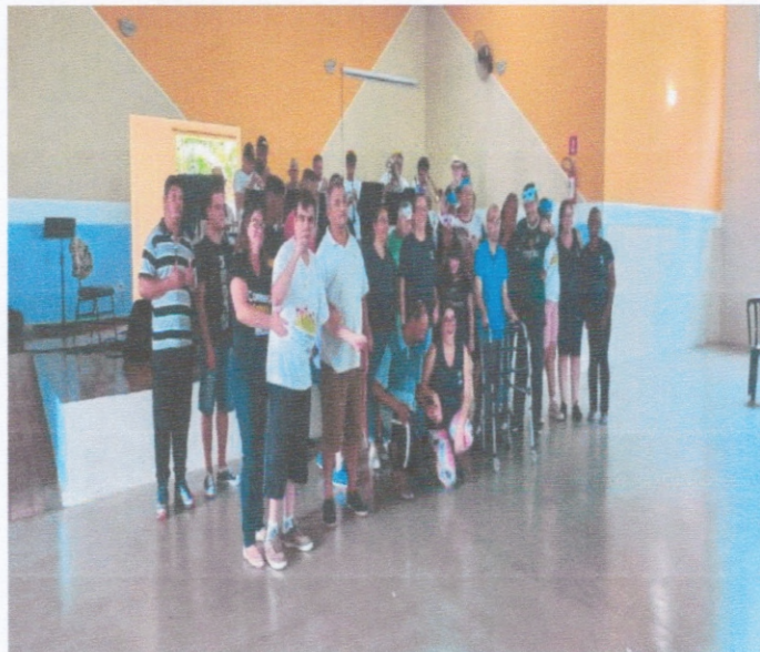
CarnaAATI com a APAE , Abrigo Vicentino e CDI