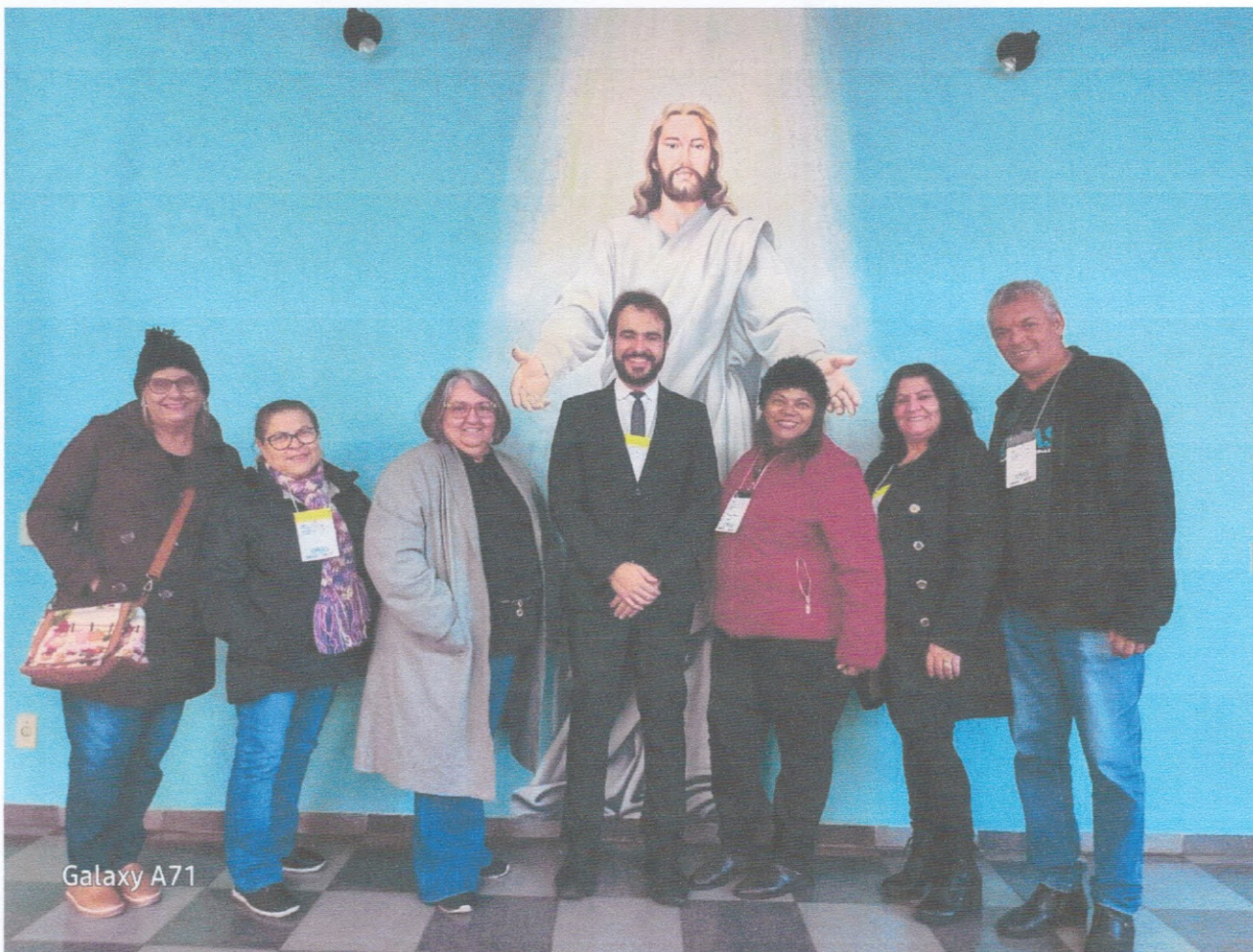
Participação Conferencia Municipal

AATI ASSOCIAÇÃO AGUDENSE DA TERCEIRA IDADE CNPJ 01746919000191