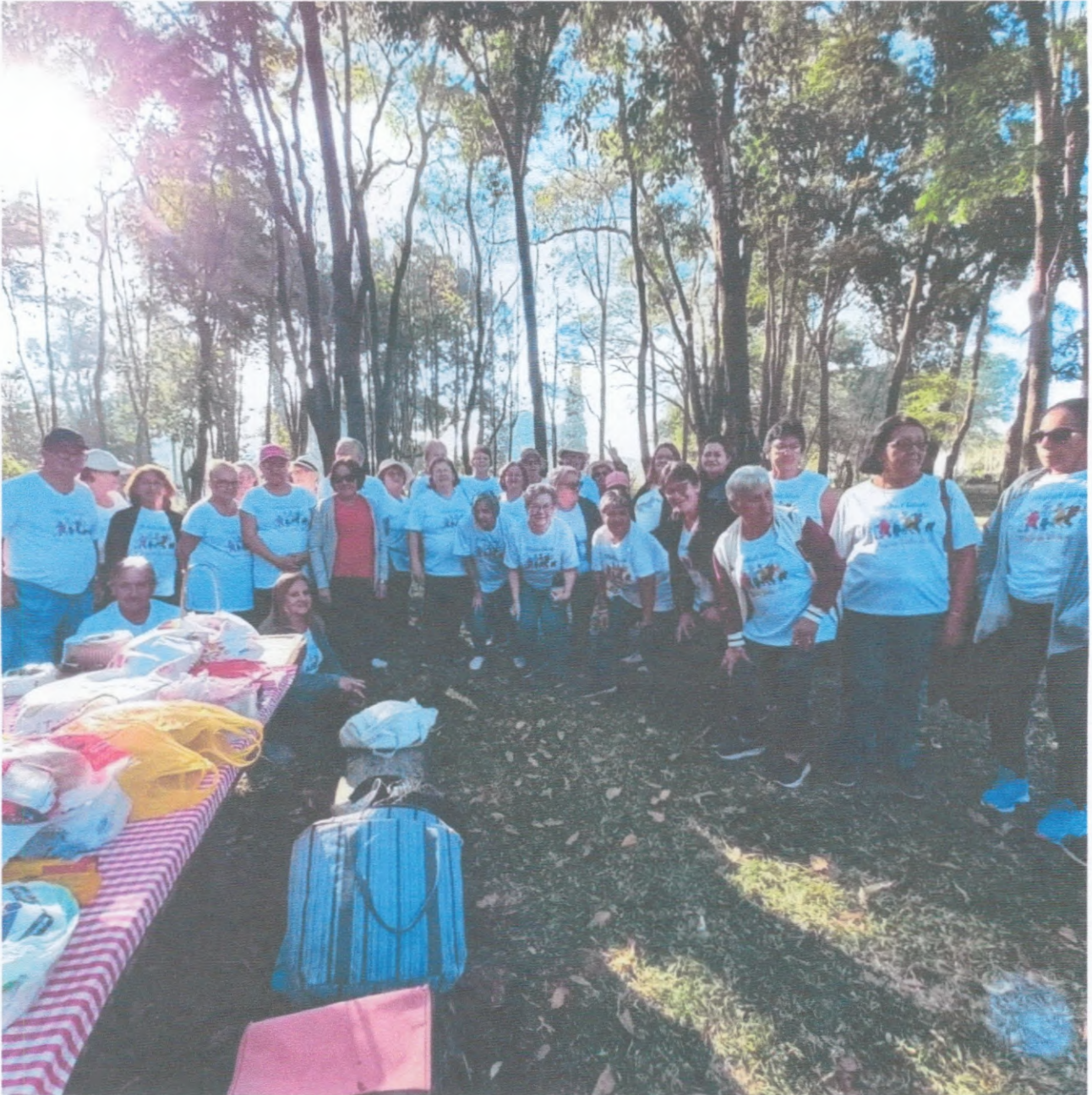
Pick Nick Família AATI