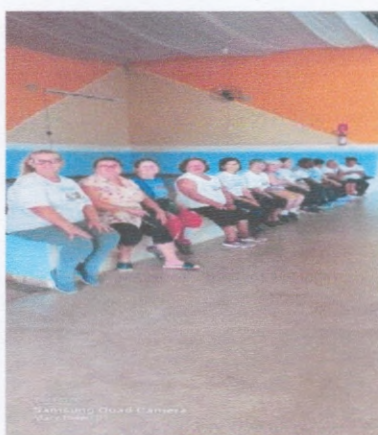
Almoço Semanal SCFV