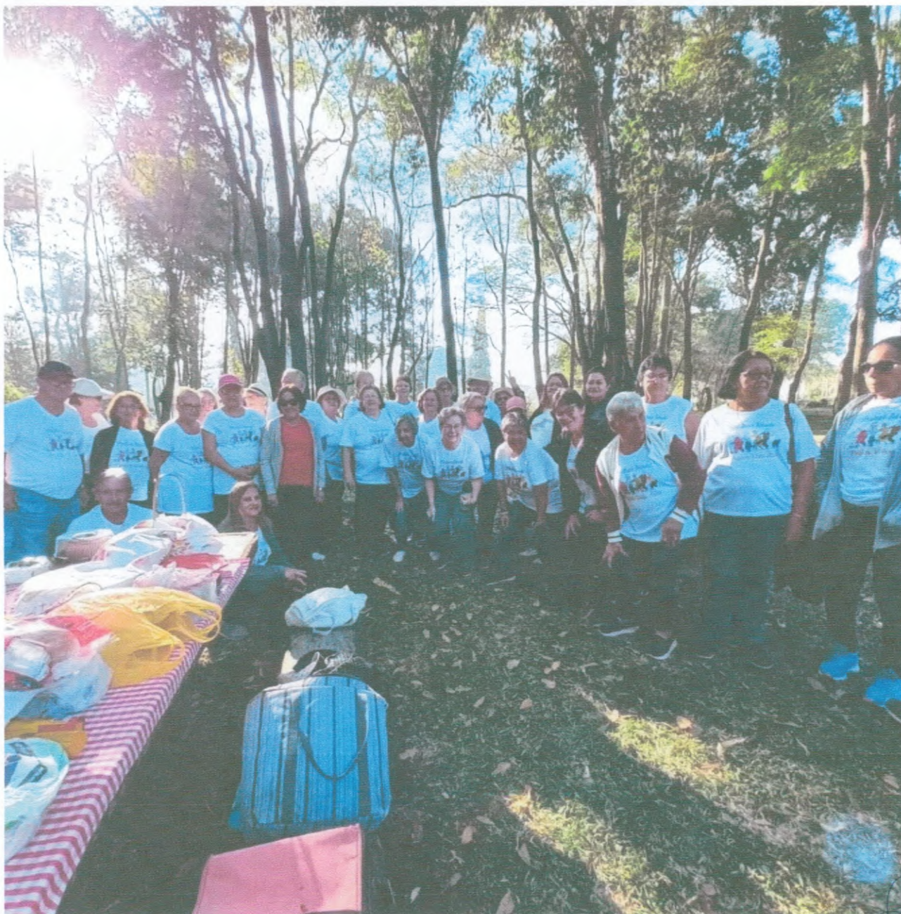
Pick Nick Família AATI