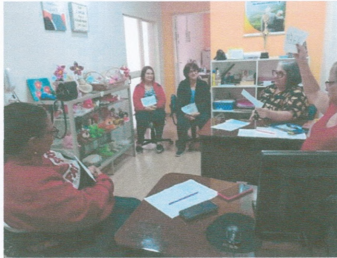
Reunião de equipe com discussão de casos