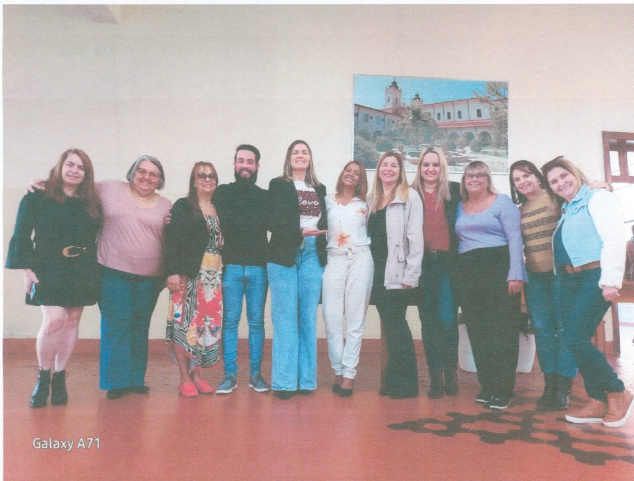
Reunião Social Seminário

AATI ASSOCIAÇÃO AGUDENSE DA TERCEIRA IDADE CNPJ 01746919000191