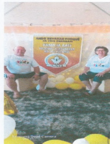
Almoço Semanal SCFV