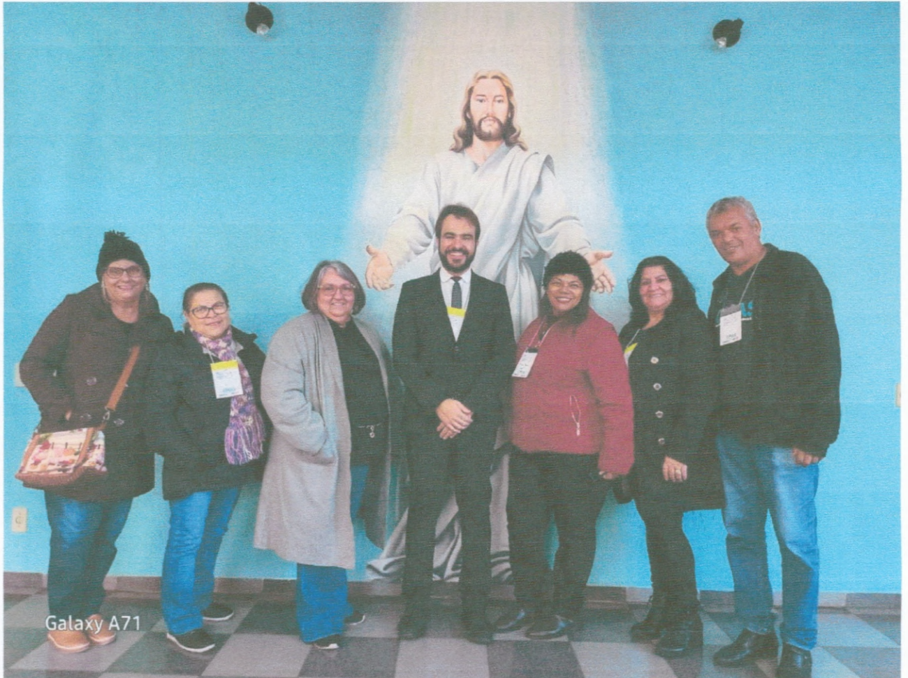
Participação Conferencia Municipal

AATI ASSOCIAÇÃO AGUDENSE DA TERCEIRA IDADE CNPJ 01746919000191