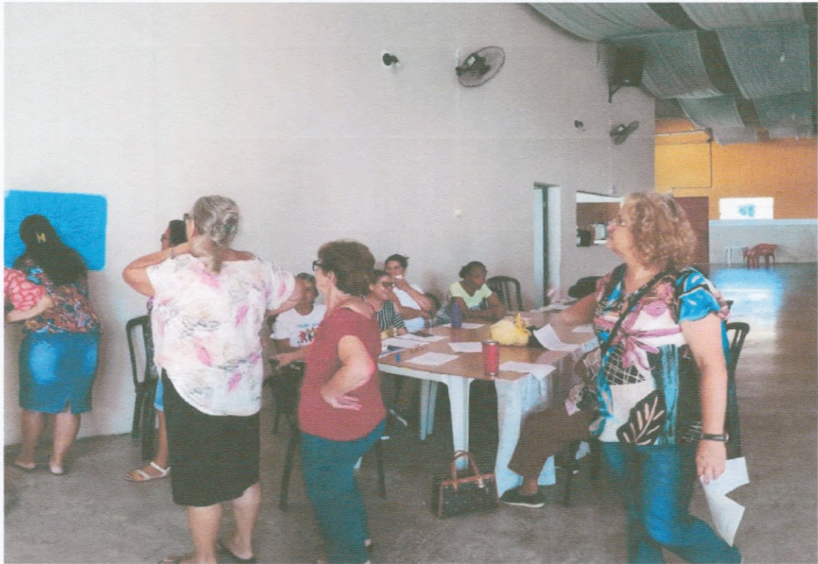
Grupo Semanal SCFV

AATI ASSOCIAÇÃO AGUDENSE DA TERCEIRA IDADE CNPJ 01746919000191