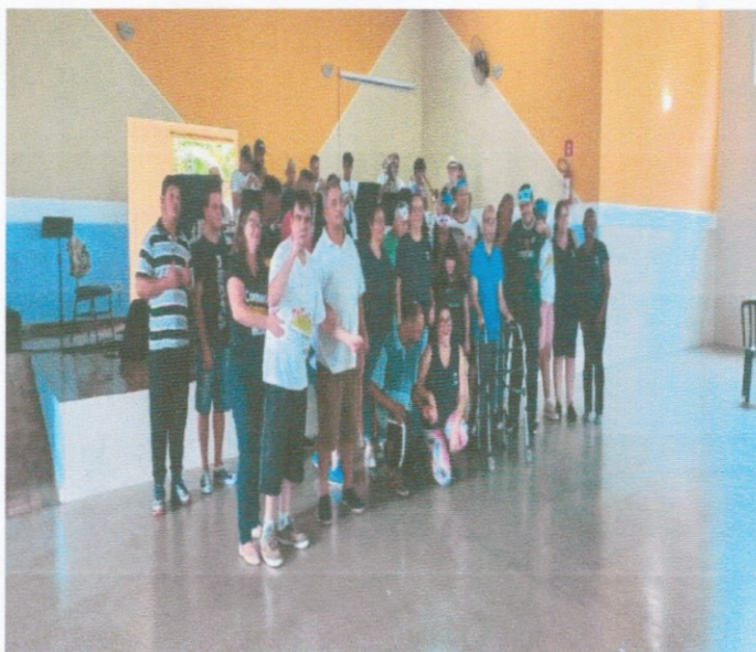
CarnaAATI com a APAE , Abrigo Vicentino e CDI