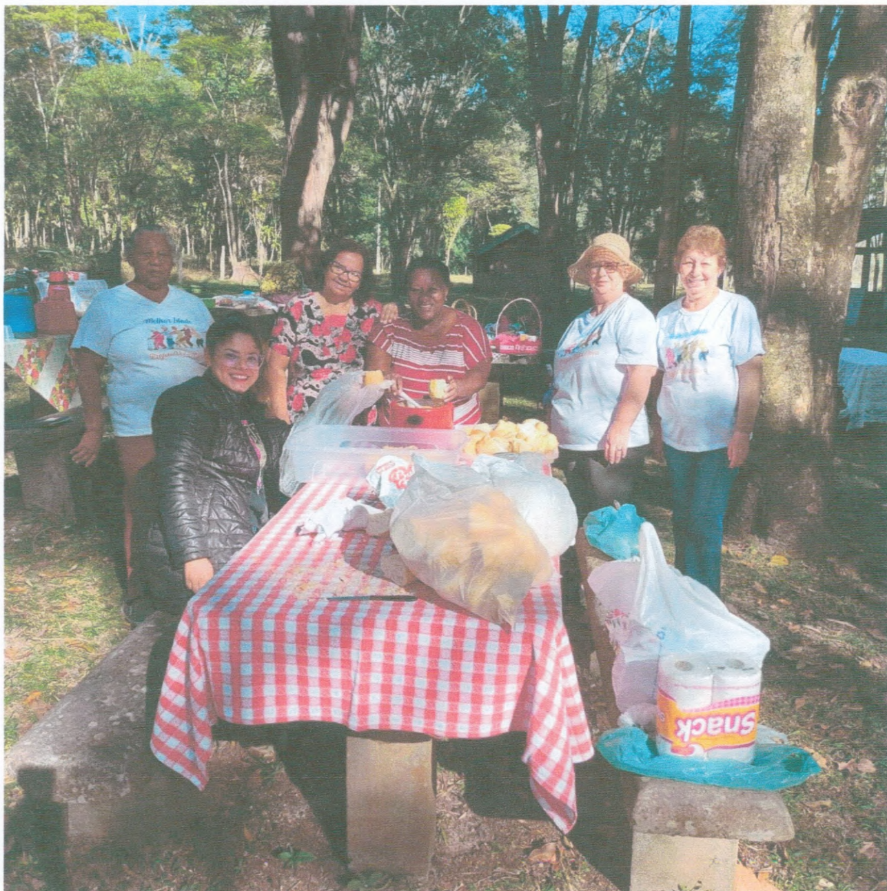
Pique Nick Seminário Família AATI Grupo SCFV

AATI ASSOCIAÇÃO AGUDENSE DA TERCEIRA IDADE CNPJ 01746919000191