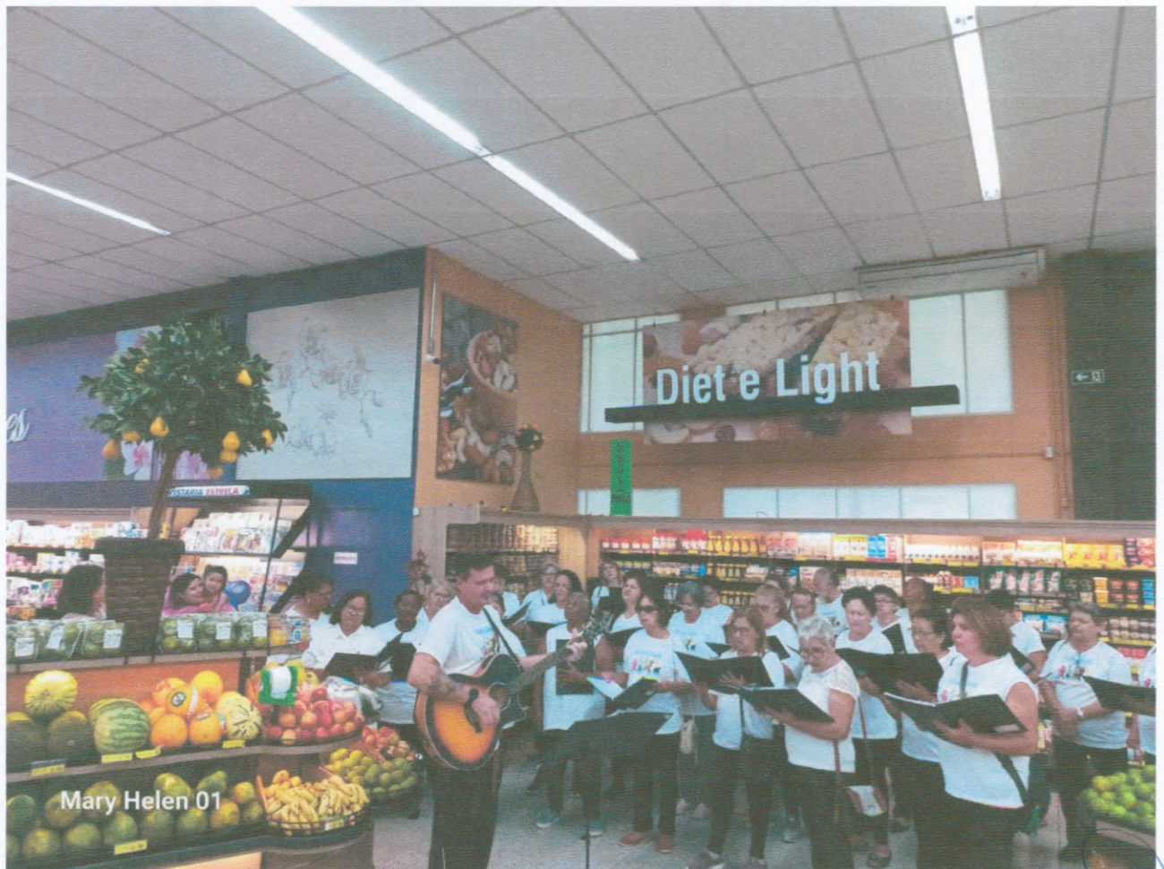
Apresentação do Coral Supermercado Estrela RUA CARLOS GOMES, 20- CENTRO - AGUDOS/SP