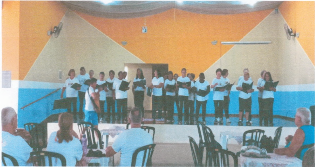
Apresentação Coral Dia Das MÃES