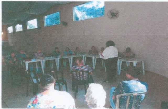
Roda de Conversa Grupo SCFV