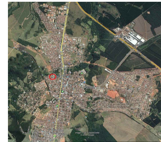
PLANTA DE LOCALIZAÇÃO Sem escala