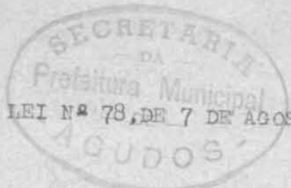
TABELA ANEXA A QUE SE REFERE A LEI Nº 78, DE 7 DE AGOSTO DE 1950.

Assinatura de telefones para as classes de comercio e profissoes;