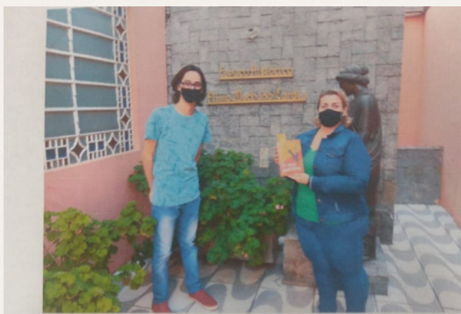
Entrega de exemplar Museu Municipal